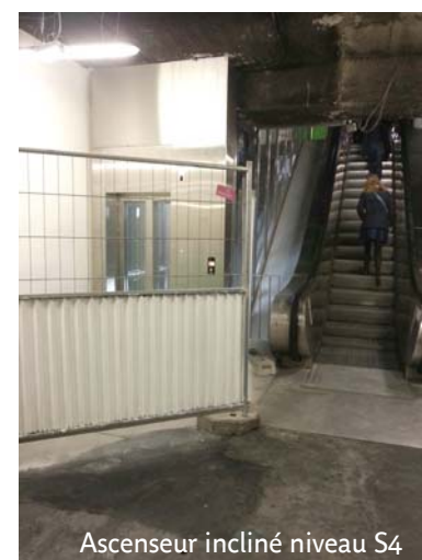
Ascenseur incliné niveau S4