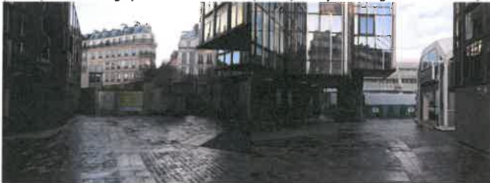
(vue depuis la place Marguerite de Navarre)