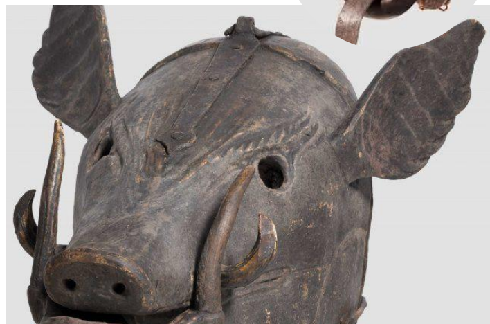
Des oreilles démesurées pour les individus indiscrets