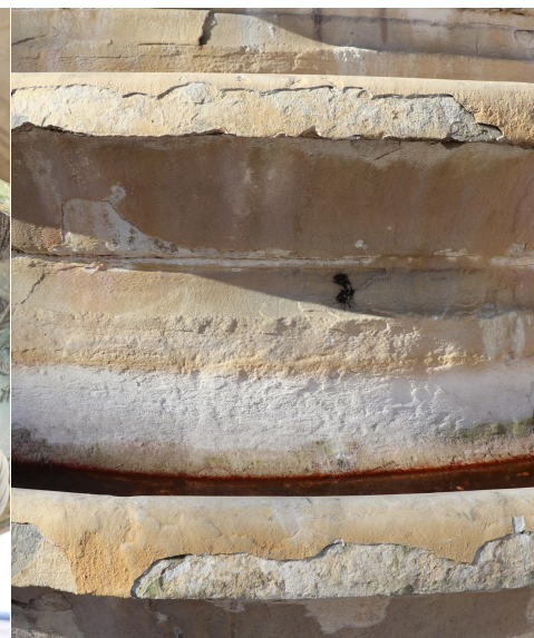
Joyau d'époque Renaissance, la fontaine des Innocents place Joachim du Bellay est un élément majeur du paysage architectural et patrimonial du quartier des Halles et du centre de Paris, mais aussi un monument en péril depuis de nombreuses années