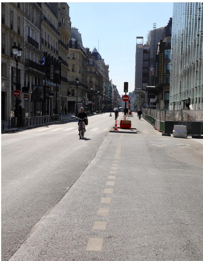
La circulation générale modifiée rue de Rivoli