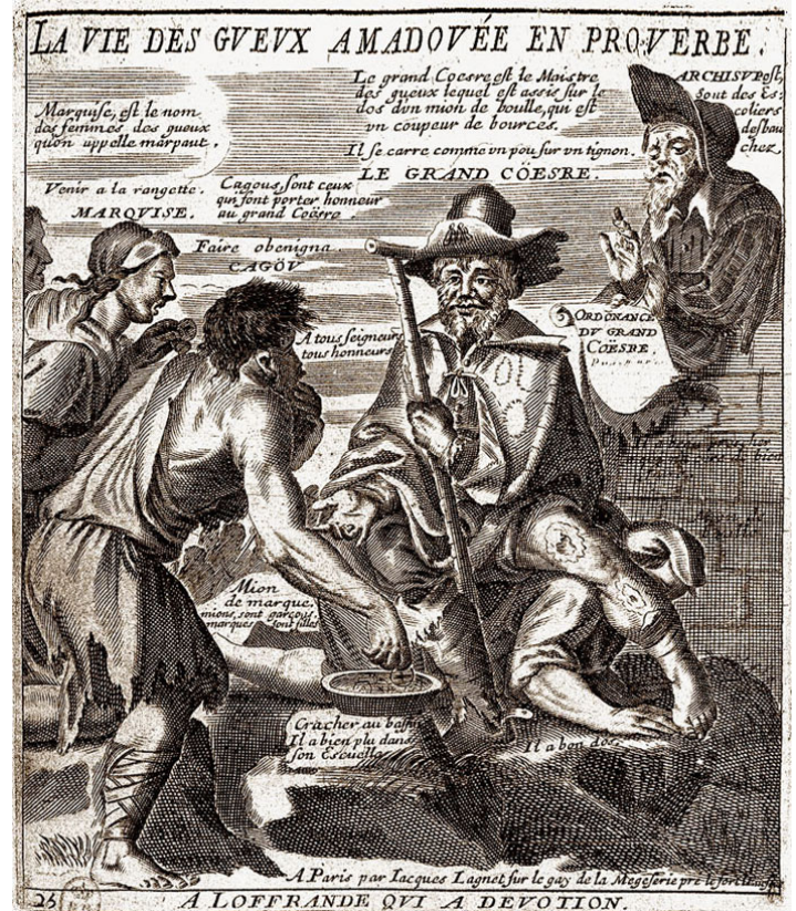
Le grand Coëstre. Gravure extraite du Recueil des plus illustres proverbes de Jacques LAGNIET, Paris, 1663

Ces cours des Miracles étaient bien organisées et extrêmement hiérarchisées. Dans le fief d'Alby, réseau de ruelles tortueuses et boueuses avec en son centre une grande place, vivent plusieurs centaines de personnes, sans se soucier des lois ou de la religion. Ses habitants sont appelés les argotiers. Ils rendent compte à leur chef, le grand Coëstre. Il porte un bonnet orné d'emplâtres en forme de couronne faite le plus souvent en bouchons. Il est vêtu d'une cape d'Arlequin. En guise de sceptre, il tient dans la main gauche un bâton de pommier et une rapière pend à son côté droit. Dans les grandes occasions, assis sur son demi tonneau, il plante sa bannière près de lui. Elle représente une fourche aux dents de laquelle pend une charogne.