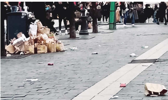
Une poubelle de rue débordant place Joachim du Bellay (janvier 2021)

Depuis la généralisation de la vente alimentaire à emporter et de la consommation en extérieur consécutive à l'interdiction de la consommation sur place, les poubelles de rue des Halles débordent souvent, souillant l'espace public ... C'est particulièrement évident place Joachim du Bellay !