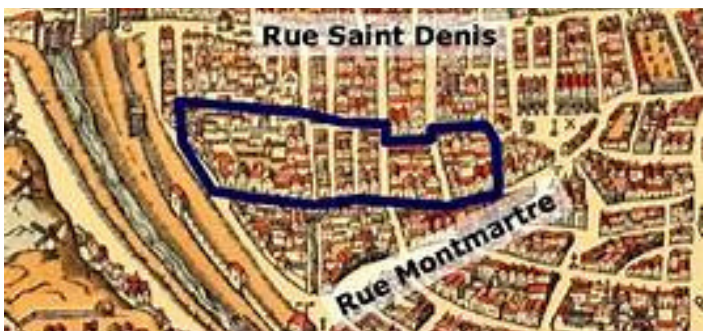
Le fief d'Alby ou Grand cour des Miracles, au nord des Halles

Mais revenons à la cour des Miracles en tant que telle, plus précisément les cours des Miracles. En effet, Paris, aux XVI et XVII e siècles, aurait compté une douzaine de cours , poches de pauvreté, fréquentées par des brigands et des pauvres gens (rue des Francs-Bourgeois, rue Saint-Honoré, rue de la Grande Truanderie, etc.). Chaque grande ville en possédait une ou plusieurs selon sa taille. La plus grande, appelée le fief d'Alby ou Grande cour des Miracles, était située au nord des Halles, sur un vaste espace compris entre les rues Montorgueil et Saint-Sauveur, et entre les portes Saint-Denis et Montmartre.