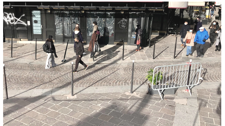
Le virage dangereux entre les rues de Turbigo et Montmartre

Dans une zone de rencontre, l'article R 110-2 du code de la route dispose que "les piétons sont autorisés à circuler sur la chaussée sans y stationner et bénéficient de la priorité sur les véhicules. La vitesse des véhicules y est limitée à 20 km/h. Toutes les chaussées sont à double sens pour les cyclistes [...]. Les entrées et sorties de cette zone sont annoncées par une signalisation [...]" .