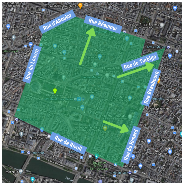
Périmètre géographique de l'option tenant la corde pour le futur conseil de quartier des Halles

Le regroupement des 4 arrondissements de Paris Centre qui vient d'avoir lieu nous rétablit dans nos frontières historiques, celles de l'enceinte Philippe Auguste et des Fossés jaunes de Louis XIII avec en leur centre un lieu chargé d'histoire, les Halles. Le secteur Paris Centre ne pouvait conserver 15 quartiers, il lui fallait s'aligner sur la moyenne parisienne et adopter une géographie novatrice pour les 6 à 7 futurs Conseil de Quartiers (CDQ) trans-arrondissements.